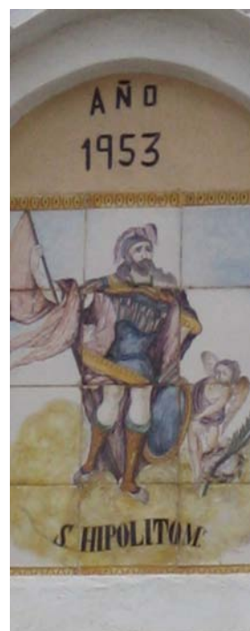
Una mostra de les obres recollides al llibre de Gregori.

L'estudi inclou un catàleg de la ceràmica que decora moltes de les façanes i interiors de La Font.