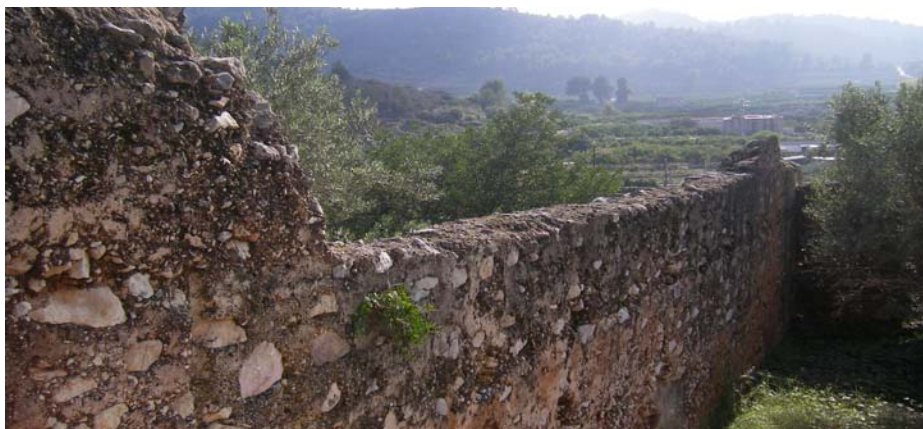
Part de l'històric recinte emmurallat del poble.