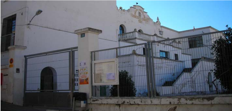
L'Escola de La Font exhibeix l'envelliment propi del pas del temps

L'Ajuntament ha donat els primers passos per a desbloquejar tres projectes llargament esperats. Amb la legalització del Pou de la Putja, l'escola serà realitat dins de'l nou PGOU. Mentres tant, el govern està a la recerca d'un solar per a l'escoleta i, a hores d'ara, una comissió especial estudia la possibilitat d'ampliar terrenys per a l'institut.