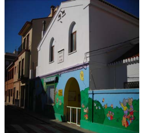
Instal.lacions de l'actual escoleta per a xiquets.

Han hagut de passar anys per a què el consistori fera front a una assignatura pendent al poble: l'educació. El nou equip de govern s'ha posat amb els deures del programa electoral per tal de fer realitat tres projectes somniats: tindre una escola i fer-ne, de nous, l'escoleta infantil i l'institut municipal.