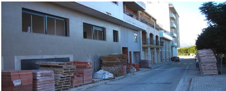
Els constructors ocupen les voreres amb material d'obra

Al tancament d'aquesta edició, el total descobert arribava als 294.000 euros. Aquesta és la quantitat que l'Ajuntament té pendent de cobrament en taxes d'ocupació de la via pública. Uns pagaments que el nou govern es trobà al encetar la legislatura "dins un calaix del consistori", segons l'alcalde.