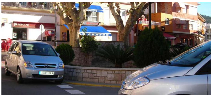
Plaça dels Xorros, amb cotxes estacionats.

Trànsit ha ordenat les zones per a vehicles a cinc carrers